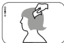
Abb. Durchkämmen des nassen Haares mit Läusekamm vom Haaransatz bis zu den Haarspitzen